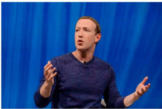
mark zuckerberg creador de Facebook

Tomado de: https://www.elespectador.com/tecnologia/gadgets-y-apps/zuckerberg-dice-que-el-futuro-de-facebook-esta-en-el-metaverso-a-que-se-refiere/