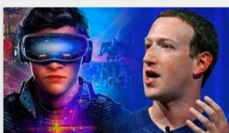
Mark Zuckerberg quiere convertir Internet en un m... vandal.lespanol.com

Piense en el metaverso como un mundo virtual inmersivo donde las personas podrán pasar tiempo juntas, de la misma forma que pueden hacerlo hoy con la realidad virtual. La gente podrá “teletransportarse” entre diferentes experiencias, explicó Zuckerberg. Este no es un concepto nuevo —durante décadas, muchas películas de ciencia ficción distópicas han estado prediciendo esto como el futuro— y aunque el CEO de Facebook comenzó a usar la terminología públicamente hasta hace poco, es algo que Facebook ha estado construyendo durante años con inversiones en realidad virtual y aumentada.