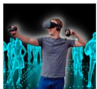
Mark Zuckerberg quiere crear u... egames.news

Lo cual es parte de la razón por la que Facebook y Zuckerberg están avanzando tan agresivamente en esta nueva frontera. Zuckerberg dice que habrá muchos ganadores en el metaverso, pero cuanto más influyente sea Facebook en su construcción, más este nuevo universo en línea reflejará la misión y el modelo de negocio existentes de Facebook en torno a conectar a las personas.